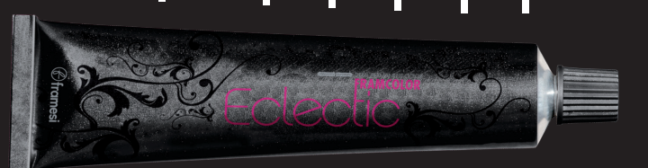
Framcolor Eclectic tube is marked in sixths.

1/6 10cc 1/6 10cc 1/6 10cc 1/6 10cc 1/6 10cc 1/6 10cc