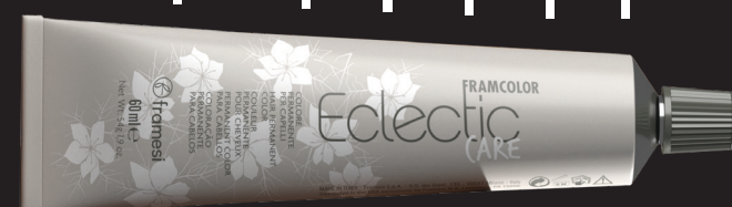
Framcolor Eclectic CARE tube is marked in sixths.

1/6 10cc 1/6 10cc 1/6 10cc 1/6 10cc 1/6 10cc 1/6 10cc